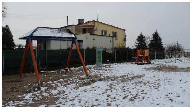
Nowy plac zabaw

• W miejscowości Oporów powstało „Miejsce dla małego i dużego” – miejsce do aktywnego spędzania czasu na świeżym powietrzu. W ramach projektu zakupiono i zamontowano 2 urządzenia placu zabaw – podwójną huśtawkę wahadłową i wieżę niską oraz 1 urządzenie siłowni zewnętrznej – twister. Plac został ogrodzony.