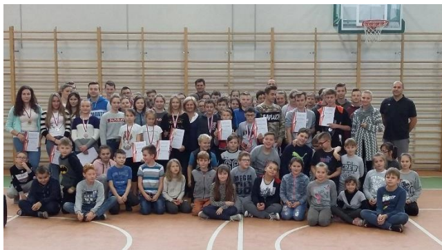
Uczestnicy „Biegu o Niepodległość”