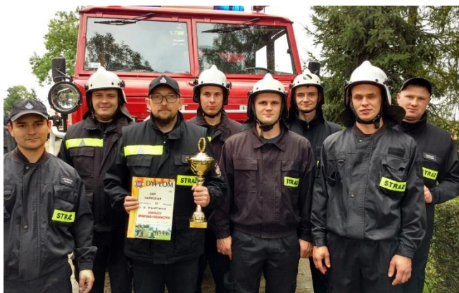
Strażacy z OSP Skórzewa

• 24 września 2017r. w IX Powiatowych Zawodach Sportowo-Pożarniczych rozgrywanych w Łaniętach drużyna ze Skórzewy zajęła bardzo dobre III miejsce ustępując tylko jednostkom z Klonowca i Pniewa.