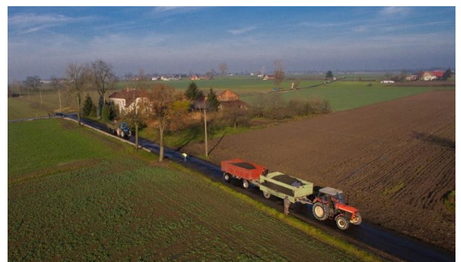
Prace przy budowie poboczy w Skarżynie

Ponadto za kwotę ponad 45 000 zł zakupiono materiał (asfalt na zimno, kruszywo, szlakę, kamień, tłuczeń), który wykorzystano do bieżących napraw dróg oraz utwardzenia poboczy, przy udziale mieszkańców za co serdecznie dziękujemy.